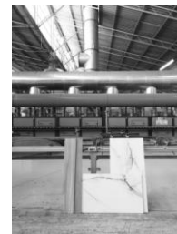
Pesquisa e Desenvolvimento de Produto