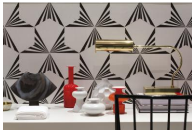
Linha Casa Vogue

Estrutura própria de design e interação com profissionais da arquitetura e design são a base para pesquisa e desenvolvimento de novos produtos.